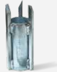
SELONEİD VALF 1/2" 24 VAC