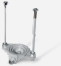
FLOWMETRE/SU ÖLÇER 150-1500 LT/H KOMPLE