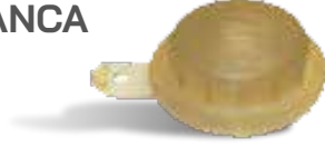
PÜSKÜRTME TABANCA MEMESİ 16 MM