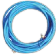
HAVA HORTUMU 10 MM 15 MT GEKA KAPLİNLİ