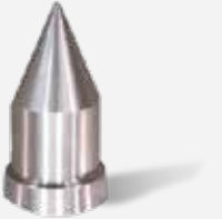
BASINÇ DÜŐÜRÜCÜ PRİNÇ FİLTRE KAPAĐI SM06T-1/2