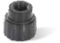
FLOWMETRESU ÖLÇER BORUSU 150-1500 lt/h